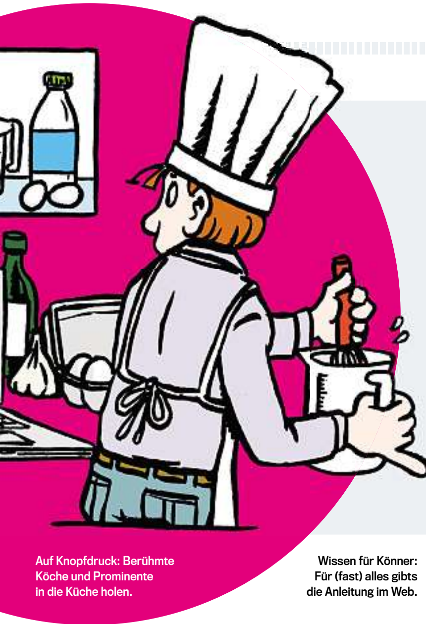
Auf Knopfdruck: Berühmte Köche und Prominente in die Küche holen.