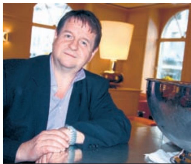
«Zuerst wollte ich, vor allem, um meiner Mutter zu gefallen, Pfarrer werden.»